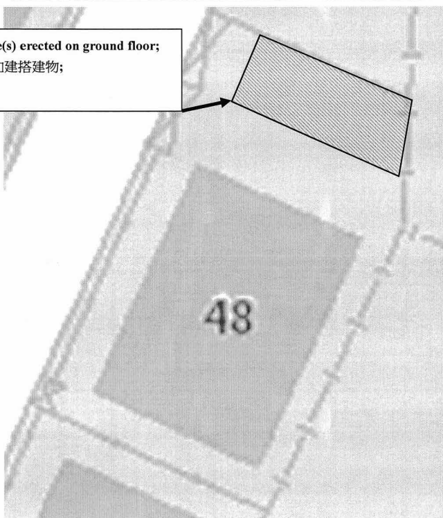
Ground Floor 地下 Location Plan 位置圖

(i) Structure(s) erected on ground floor; (i) 在地下加建搭建物;