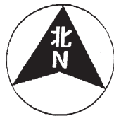
圖一 Drawing No. 1